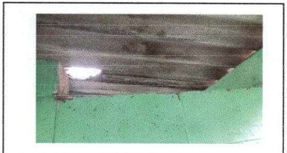
FOTO 4: SUSTITUCION DE LAMINA POR LAMINATROQUELADA ALUZINC CALIBRE 26 (EN BAÑOS)