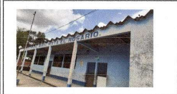
FOTO 1: SUSTITUCION DE LAMINA POR LAMINA TROQUELADA ALUZINC CALIBRE 26