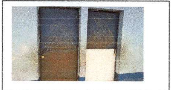
FOTO 2: MANTENIMIENTO A ESTRUCTURA (LIJADO, CAMBIO DE TUBO, CEPILLADO, SUJECION, APLICACIÓN DE PINTURA) EN AULAS